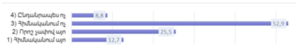
Իրավախախտ անչափահասների նկատմամբ հասարակության հանդուրժողականության և աջակցության դրսևորումն ըստ հարցվողների

Ինչպես երևում է գծապատկեր 7-ում հարցվողների կարծիքով հասարակությունը հիմնականում հանդուրժող և աջակցող վերաբերմունք չի ցուցաբերում անչափահաս իրավախախտների նկատմամբ՝ 61,8%: Մինչդեռ վերջիններս պատրաստակամություն են հայտնում մասնակցելու համայնքում իրականացվող այնպիսի միջոցառումներին,